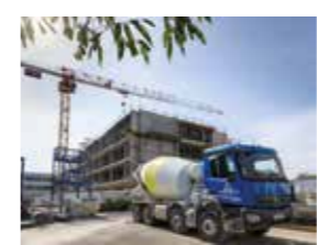
Flotte Bronzo Perasso

Nous disposons d'une flotte de véhicules adaptés à vos chantiers : camions toupee de 4 à 8 m3, camions pompe et pompes automotrices équipées de flèches.