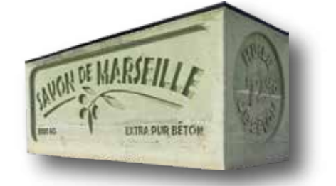
Aménagements L2 - Marseille

Nous disposons d'une flotte de véhicules adaptés à vos chantiers : camions toupee de 4 à 8 m3, camions pompe et pompes automotrices équipées de flèches.