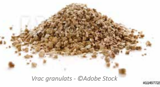
Vrac granulats