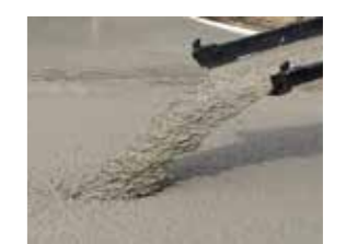
Coulage de béton

NOUS VOUS PROPOSONS UNE LARGE GAMME DE FORMULES BÉTON DE TYPE BPS : BÉTON À PROPRIÉTÉS SPÉCIFIÉES