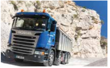
Flotte Bronzo Perasso