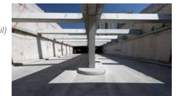
Chantier Boulevard Urbain Sud - Marseille