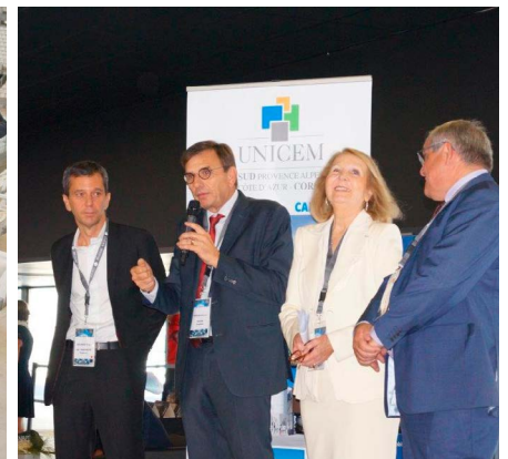
12 carrières diplômées Charte Environnement et 1 agence régionale diplômée Exemplarité Charte RSE

La remise des diplômes Chartes Environnement et RSE s'est déroulée lors de la seconde édition du Congrès régional de l'UNICEM PACAC qui a réuni plus de 400 participants le 09 octobre 2018 au Stade Vélodrome. Tout au long de la journée, les sites diplômés et les démarches Chartes Environnement et RSE ont pu être présentés au plus grand nombre. Cette année, ce sont 12 carrières qui ont été mises à l'honneur (5 sites validés Maturité – 7 sites validés Exemplarité) pour la Charte Environnement, et 1 agence régionale validée Exemplarité pour la Charte RSE.